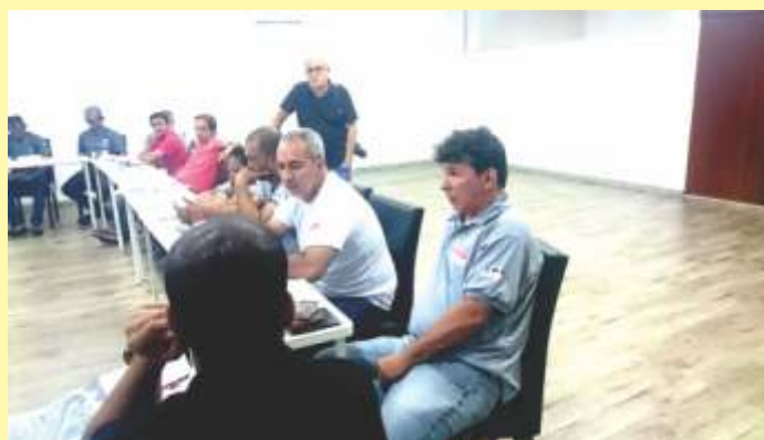
Foto acima e à direita: Flagrantes dos debates de membros da Diretoria Executiva da FITEM/CUT durante a primeira reunião administrativa trimestral do ano de 2017, em Paracatu-MG.